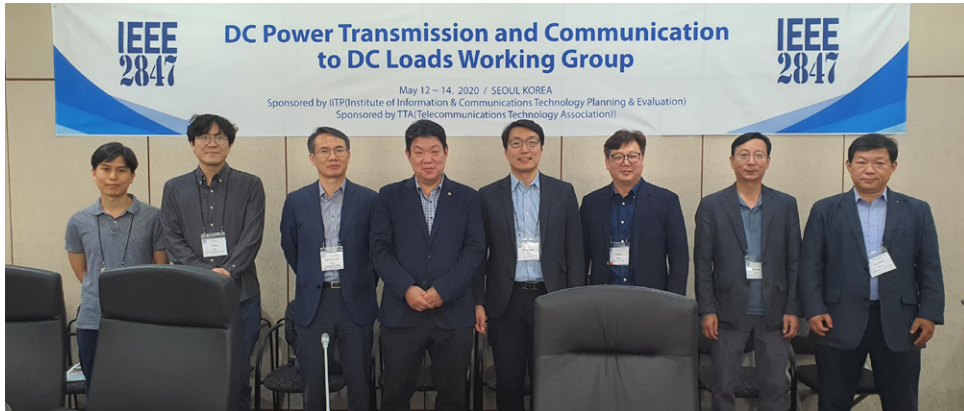
[그림 3] 창립총회 기념 사진

한다. 다른 그룹과 어떤 점이 다른지도 보여주어야 한다. 이 과정에서 스폰서 위원회의 의장과 수차례 이메일로 연락한다.