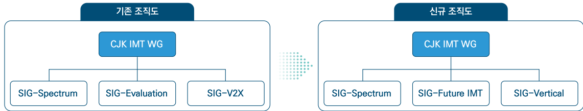
[그림 3] CJK IMT WG 산하 SIG 재정비

한 협력 프레임을 활용하여 ITU-R 국제표준화를 주도하는 것에 대한 심도 있는 논의가 표준화 전문가 집단 내에서 필요하다. 또한 2020년 6월 25일에 창립회의를 개최한 TTA의 이동통신기