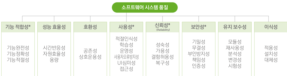
[그림 1] 소프트웨어 시스템 품질 모델 [1]

[그림 1]은 소프트웨어 시스템의 품질 모델을 나타낸 것이며, 품질을 정의하는 속성(녹색 음영) 및 하위 속성(음영 부분 하단)이 명시되어 있