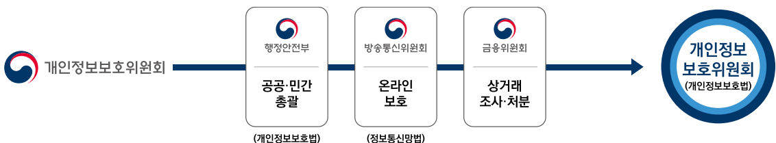
[그림 1] 개인정보보호위원회의 역할

이와 함께 개인정보보호위원회는 개인정보의 보호에 기반한 안전한 활용을 위해 가명정보와