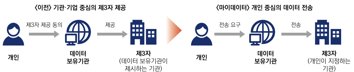
[그림 3] 마이데이터와 제3자 제공 비교

개인정보보호위원회는 전 분야 마이데이터를 도입하는 개인정보 보호법 개정안의 국회 통과 이후 마이데이터의 본격 시행을 위해 시행령, 고시, 가이드라인 등 하위법령의 제·개정을 추진할 계획이다. 법률에서 위임한 정보제공자 및 정보