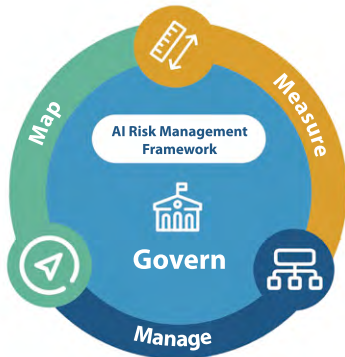
[그림 1] AI RMF

월 동안 AI RMF를 개발해왔으며, 초안에 대한 400여 개의 공식의견을 반영하였다. 프레임워크는 다음 두 개의 파트로 구성된다.